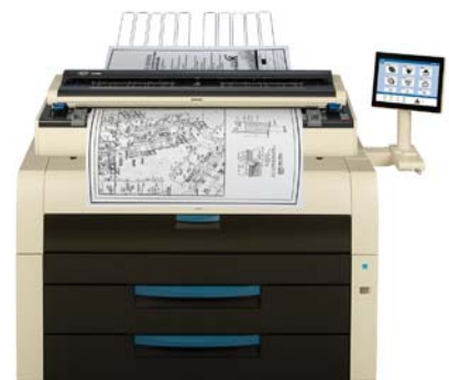
KIP 7990 Produktions-MFP