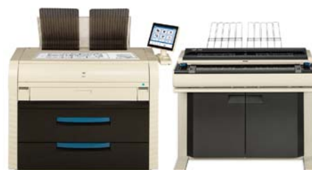
KIP 7590 Produktions-MFP Abgebildet mit optionalem KIP Scannerständer