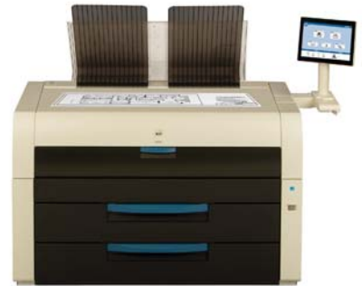
KIP 7970 Drucksysteme