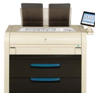
KIP 7570 Drucksysteme