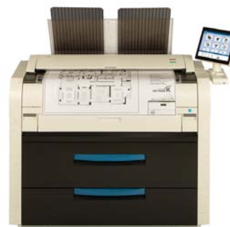
KIP 7580 MFP