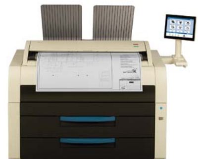
KIP 7980 MFP